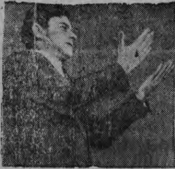
Суред вылын: Испанской Коммунистической партилэн генеральной секретарез Хозе Диас эш трибуна вылын.

Аслаз докладаз Хозе Диас эш враз, что калык, кудйз аслэстыз защитазэ собственной киулаз басытйз, вормемын уз луэ.