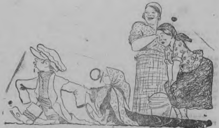
— „Ма та Миша аслэстыз пинал'ёсэ таче дясам?“ — Со соосты, яна потйсь семьяослэсь член'ёссэс кадь дополни- тельно пиусадебной участоклы ыстыз...

Редакторлэн замез. Н. К. Преображенцев Поттйсь Райсполком.