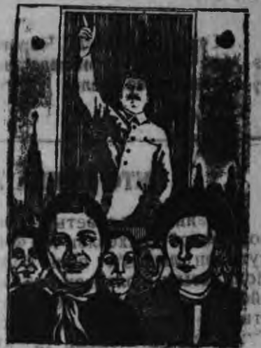
Изогизлэн плакатэз, М. Волкова М. Динус художник'ёслэн ужзы.

Дано мед луоз СССР-ысь равноправной нылкышноос, куньы государственной, хозяйственной но культурной ужын активная участницаос!