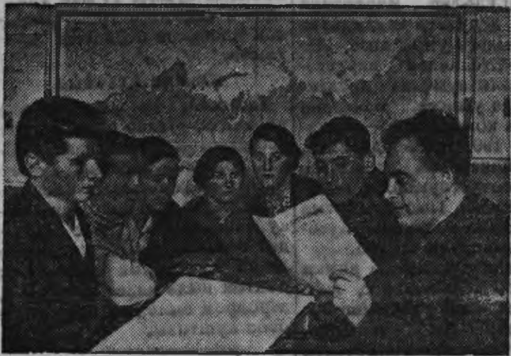
Суред вылын: Рославльской фельдшерскойш колалэн 3-тй курсысьтыз студент'ёслэн РСФСР-лэсь Конституциез изучить карон'я кружоксылэн занятиез.

РСФСР-лэн Верховной Советаз выбор'ёслы дасяськон