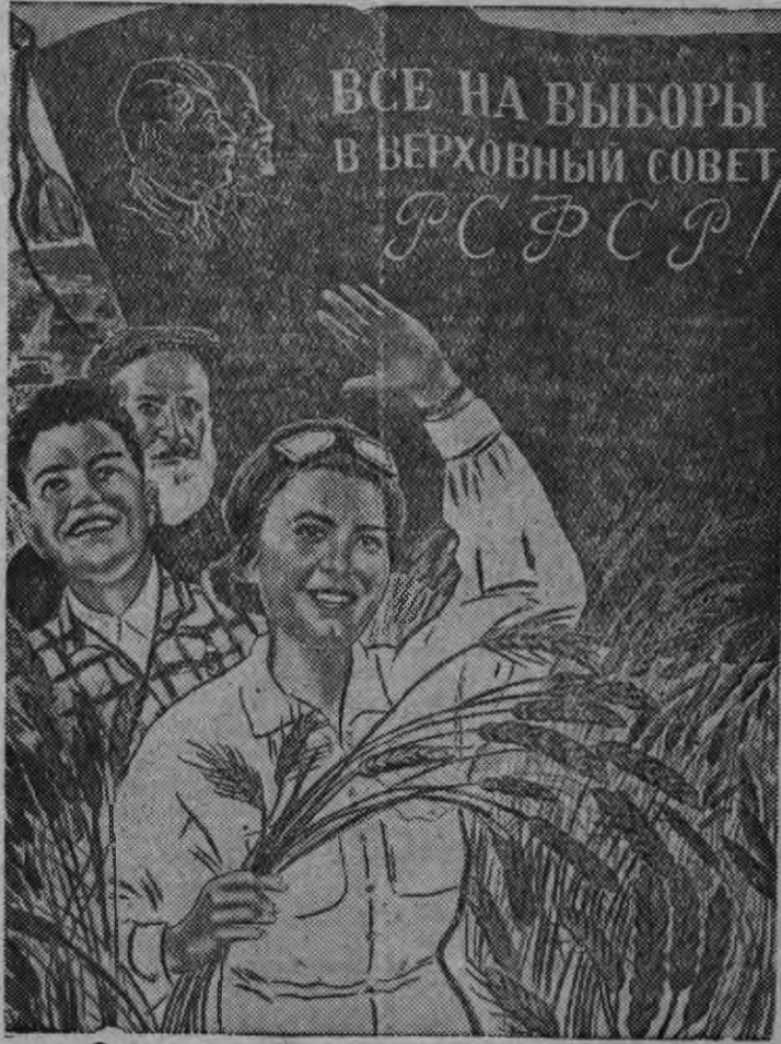
Суред вылын: Шубина художниклэн "Все на выборы в Верховный Совет РСФСР" плакатэз ИЗОГИЗ-эн чебер краскаосын поттэмын.

Кин стремиться карыське со понна, чтобы асьме колхоз'ёс но совхоз'ёс асьме кунлы уно сельскохозяйственной продукт'ёсты сётыса азыланын но мед сяськаяськызы, большевик'ёслэн партизы понна со голосовать карыз, коммунист'ёслэн но беспартийнойёслэн блоксылэн кандидат'ёсы понна со голосовать кароз.