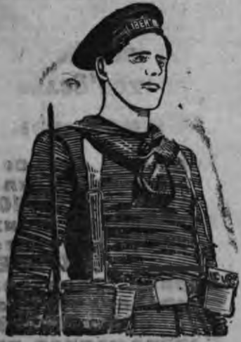
Суред вылын: республиканской флотлэн мряке.