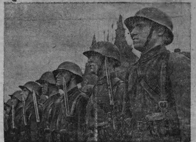
Московской Пролетарской стрелковой дивизилэн боец'ёсыз парад азын.

1-тй мае 1938 аре Мэсквалэн Красной площадью Рабоче—Крестьянской Красной Армиелэн но Военно—Морской Флотлэн частьёслэн парадзы орчиз.