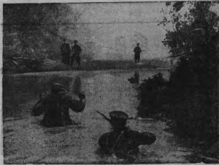
Фильмлэн суредьсытыз. Диверсантэз кутон дыр.

Асьме рийонной центрамы та картина 14-15 апреле вал. Кык нунал чоже мыныса „Киров“ нимо клублэн зрительной залэз калыкен переполнить каремын вал.