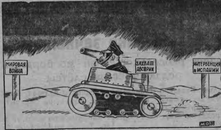
Германской фашизмлэн столбовой сюресэз.