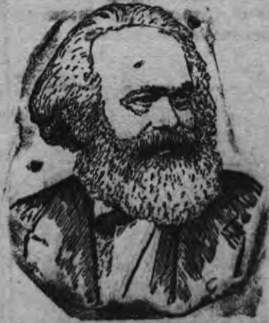
Карл Маркс (1818—1883 арёс)