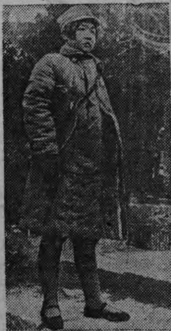
Студентка-китайка боевой вооружениын.

Цзянсийн (Китай) студенческой батальон сформировать каремын, татын 150 китаеностуденткаос л’ыд’яско.