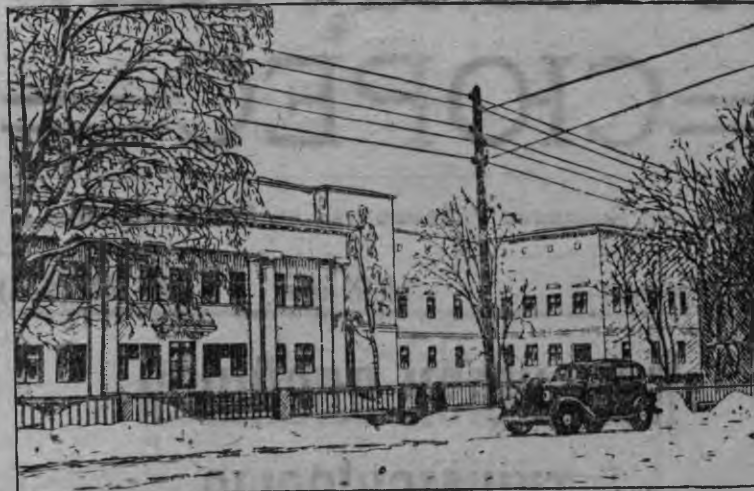
Петрозаводскын „С. М. Киров“ нимо ульчаын родильной домлэн выль зданиез.

СССР-ысь город’ёсын Петрозаводскын (Карельской АССР) выль родильной дом ус’тыське.