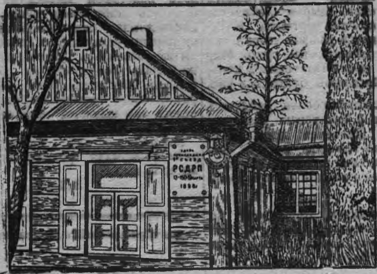
Коркалэн фасад вылаз мемориальной доска

Минскийн, кытын 1898 арын РСДРП-лэн 1-тй с'ездэз ортчыз, коркалэсь тусэ сыче ик берыктэм бере посетительёс понна исторической корка усьтэмын