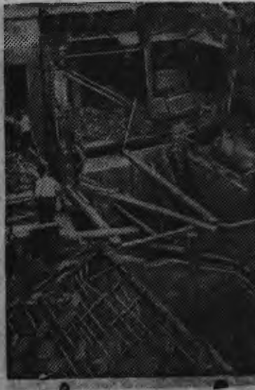
Фашистской самолет'ёсын бомбардировкаен разрушить карем Барселоньсь юрт.

Испаниясь город'ёс вылэ фашистской авиацилэн налэ-тээ.