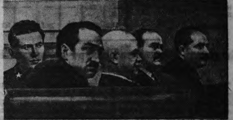
Национальностьёслэн Советсылэн Сессияз ЕЖОВ, МИКОЯН, КОСИОР, МОЛОТОВ но КАГАНОВИЧ эш'ёс.