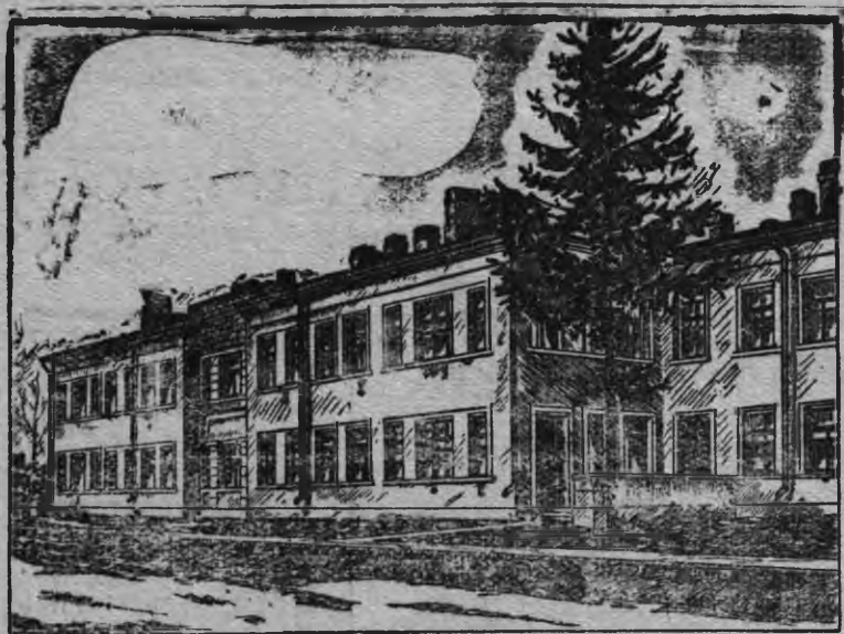
Избирательслэн куремзыя Череповец городын, Волгодской областын, горсовтэн 80 нылпын выльс ясли пуктэмын но усьтэмын ни