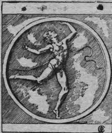
Барельеф „эстафетан“ (төды глазуранной форфоралэсь) суредзЭлена Янсон—Манизерлэн. Та чэ барельефон „Динамо“ станци оформит каремын луоз.