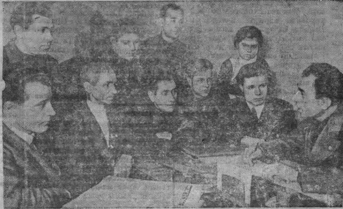
Москваысь Л. М. Кагановичтэ нимчлыз нимчэм проэктэз зээдэсь стахановец'ёс Сталинскы й декадэз быдэстэм обязател'ёссылэсь быдэстэмэз обслукиль карэ.