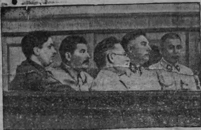
Суредын (паллянысен бурпала): Г. М. Маленков, И. В. Сталин, М. И. Калинин, К. Е. Ворошилов но Н. И. Ежов эш'ёс РСФСР-ысь Верховной Советэзлэн нырысь сессияз.