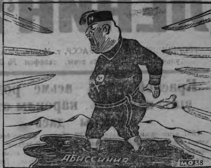
— Ура! мон Абессиниез басты — Вай сое татчы... — Озы со монэуг лэзы.

Абессинийн итальянской захватчик'ёслы пумит пур'эськөн минэ но эшшо будэ но. (Газетсы).