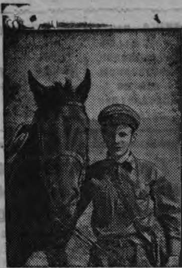
Суредн. Ворошиловской всадник'ёс клублэн членэз Фрунзе нимо ФЗУ школанн дышетсис (Шуя, Ивановской область) Федоров В. Областной конноспортивной соревнованияны 2 жетон бастыз.

Абессинийн итальянской захватчик'ёслы пумит пур'эськөн минэ но эшшо будэ но. (Газетсы).