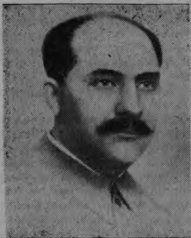
Л. М. Каганович эш, Удмуртской АССР-лэн Верховной Советаз депутатэ кандидат.

Сталин эшлэн но солэн матысь соратник'ёсызлэн Удмуртской Автономной Советской Социалистической Республикалэн Верховной Советаз депутатэ баллотироваться карыны согласие сётэмзы Удмуртиысь трудящойёслы величайшой шуд но данлык.