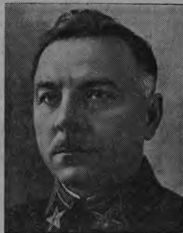
К. Е. Ворошилов эш, Удмуртской АССР-лэн Верховной Советаз депутатэ кандидат.