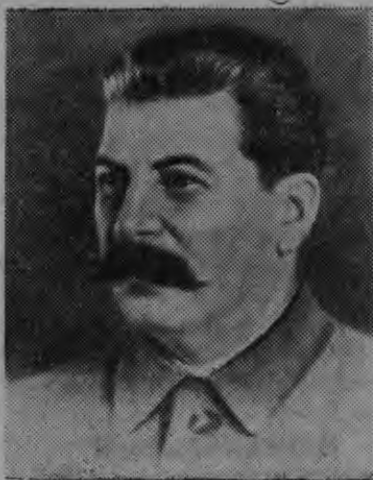
И. В. Сталин эш, Удмуртской АССР-лэн Верховной Советаз депутатэ кандидат.