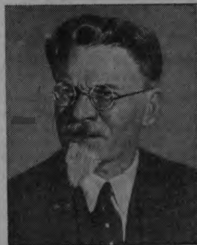
М. И. Калинин эш, Удмуртской АССР-лэн Верховной Советаз депутатэ кандидат.