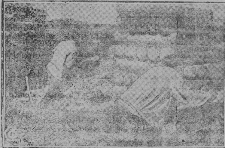
На снимке: Скорка балансов на красноборской лесной бирже (Сев. край) для отправки в Архангельск и за границу.