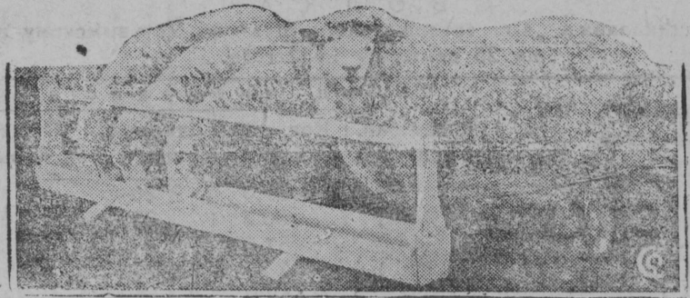
На снимке: Породистые овцы в совхозе „Заречье“ Московской обл, эти овцы ввезены из Англии для племенного размножения