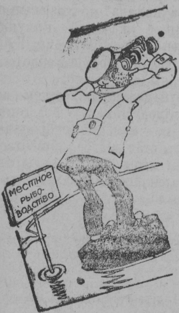
ЛЕСРАБКОПЧИИ: А далеко все-таки до привозной рыбы. Ух, как далеко. Плохо и выдать

Чері—28%, Јај—1,4%, Коле—30%, Картунель—4,95% мукөд пөдлөс градывв пунктас—2,1%, Көс-шак—2,6%, Сола-шак—?. Свежөј-шак—?. Вотысјас—37,9%, Көч-јај—?.