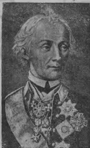
А. В. Суворов.

Требби шур'эс но Нови-город дорысен француз'-