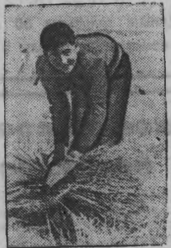
Суред вылын: Республиканской армиясь боец крестьян'ёслы ю октыны-калтыны юрттэ.