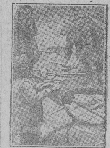
Снимок:раздача обедов в поле