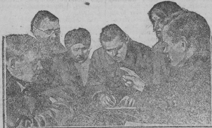
Колхозники коммуны им. Володарского заключают соцдоговор