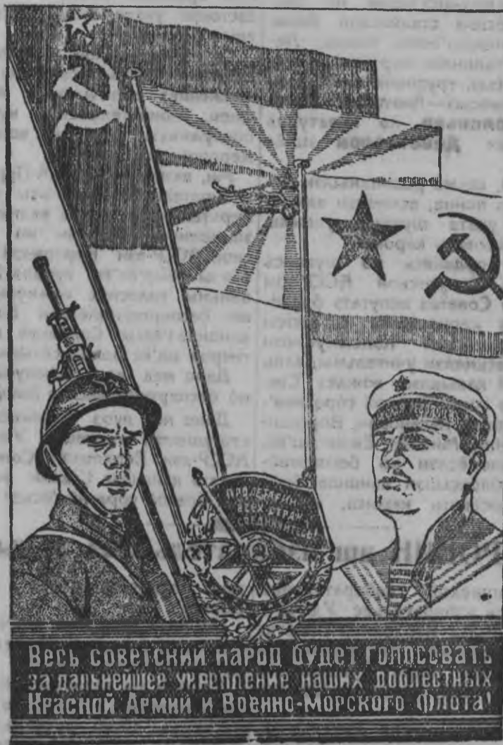
В. Стенберг художниклэн лэсьтэм плкатэз, Изогизэн поттэмын.

б) льнопункт'ёсты, льносушилкаосты но етйн куро тырыны липет'ёсты тупат'анэз но лэстынэз 15 июльлэсь бере кылытэк быдэстыны.