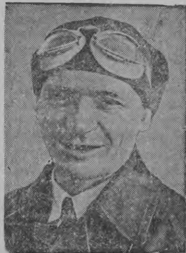
Суред вылын: В. К. Коккинаки.

ГЕРОИЧЕСКОЙ ПЕРЕЛЕТ СССР-лэн Верховной Советэзлэн депутатэз летчик-высотник В. Коккинаки но замечательной штурман А. Брядинский эш'ёс Москва—Хабаровск—Владивостоклэн районаз 24 час но 36 минут кустын 7600 километр шуг скорестй ортыса героической перелет лэсьтызы.