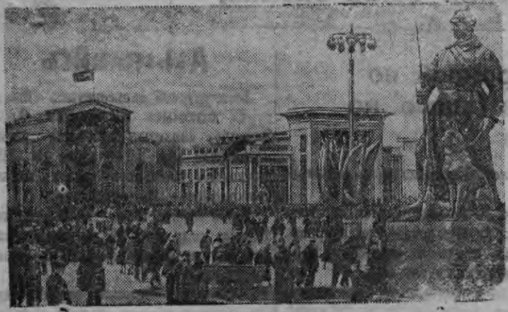
Колхоз'ёслэн площадьы выставкаез устын пунала.