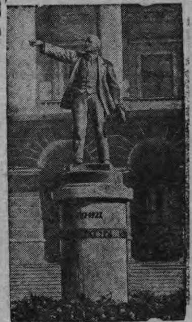
Смольной дорын В. И. Ленинлы памятник (Ленинград)

лын быдэстон понна нюр'ясконо. Сола понна первичной парторганизацилэн секретарезлы Лекомцев эшлы вис карытэк проверять карылоно коммунист'ёсызлэсь конспект'ёссэс, беседаос орчмыт'ялланно но сётылоно конкретной юртгэт.