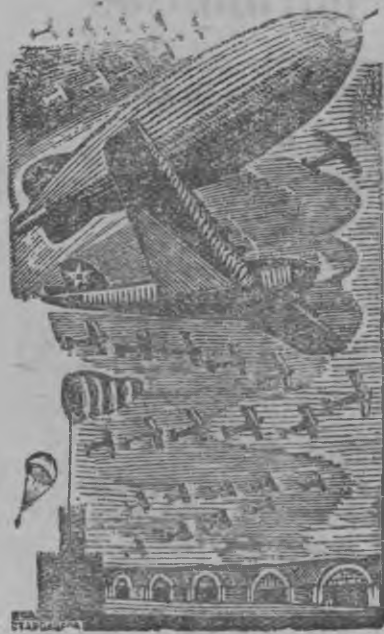
„Асьмелэн бй вал авиационной промышленностьмы. Асьмелэн со вань табере“. (И. Сталин).