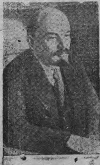
В. И. Ленин (1921 арын)