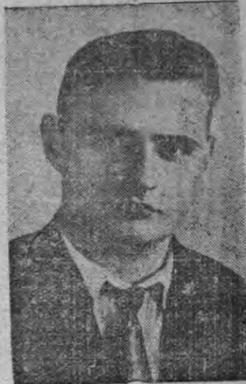
СНИМОКЫН: «Седов» ледоколлэн капитанэз Константин Сергеевич БАДИГИН.