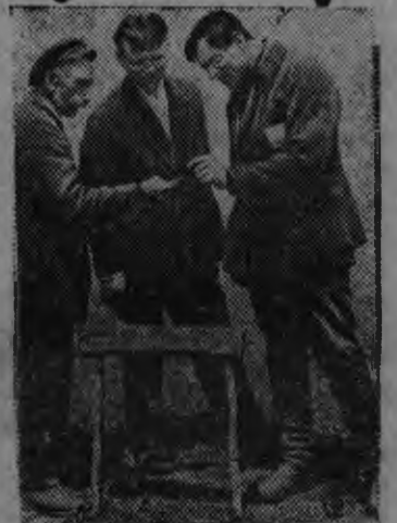
Ленинлэн нимыныз нимам колхозысь (Кавказстан) сигнализатор выльсь мотылёк (вредитель) карисез, шедьтыса сельсоветлэн председателезлы возьматэ.