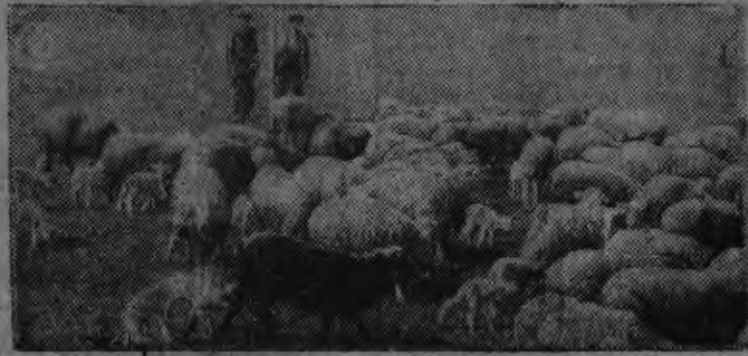
Ыж'эсыз шараямын умой чылкыт лэстбичины вордонэ