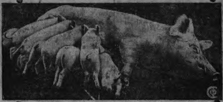
„Нива криница“ колхозлэн (Азово-черноморский край) Английской выжы парсеэ. Парсьелэн 18 йыр пиосыз. Соос ваньмыз одйг кадэсь будо.