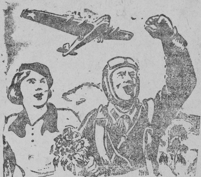
Мөд олас мјан рөднөј некодөч вермытөм Краснөј армјја—СССР-са јөзјас мирнөј ужлөн вынөјөра оплот, Октабрскөј революцјјаса завојөванјелөн вернөј страж!