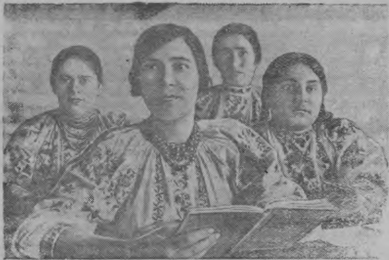
„Шляхом Ленина“ колхозын (Винницкой область, Винницкий район) умой ужа стахановской школа. Стын дышетско вань бригадир'ес, звеньевоёс, даяркасс, кснюх'ес но уноез колхозник'ес.