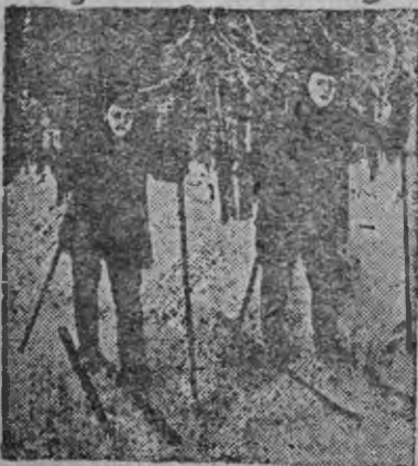
СНИМХАСОНТЬ: Н-ской стрелковой полковъ якстерьармеецт Соколь-никсэ лыжной станциянь панжомачинть