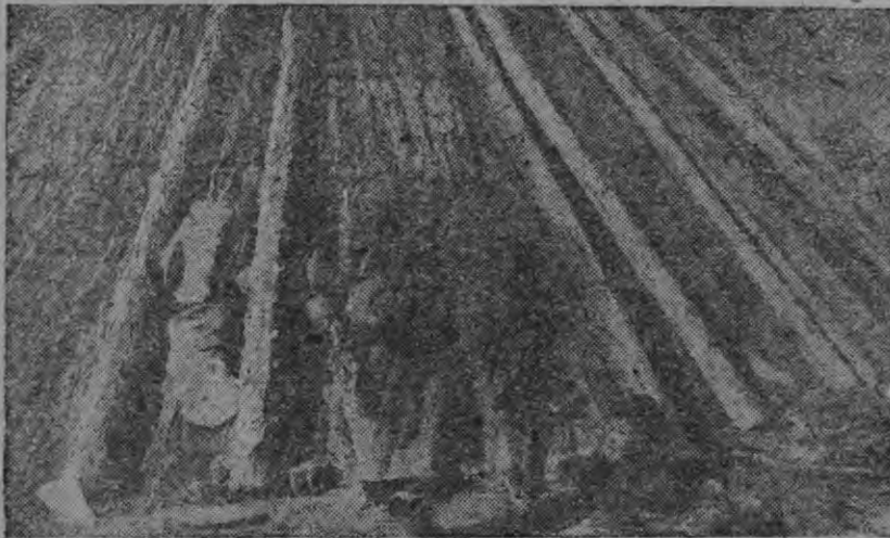
Паксынь келес ульнесть вейте-зайга сралезь ойротнэнь юртат не (нудотне)... СНИМКАСОНТЬ: Ойротнэнь семьясь эсь юртанзо икеле.

Сень эйстэ неяви дикостесь, што мейгак таркань-таркань кантлить жертвакс жив лишмет. Ойротнэнь иорост арасельть Анемлик пейдемадо Киштемась мельсэнзьяк арасель. Музыкакс ульнесь баня-корьклань кондыамо бала лайка, конань эйсэ морась ансяк евксонь евтниця. Те евтницянь вйгельдензэ тандады эволь ансяк эйнакш, тандады покш ломань.