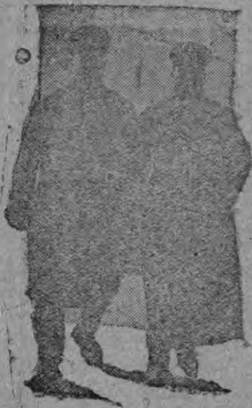
Маень васенце чись Московсо

Партиянтэ виде политиканзо тевс ютавтозь, ленинэнь национальной политиканть видестэ ветязь большевикень печатесь, большевикень печатазь валось терди весе мастер лангонь октябрынтэ теёмө