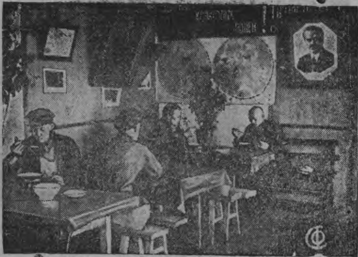
СНИМАСОНТЬ: Кимре кой районсо, Медведицной кол- хозонь столовоэзэ.