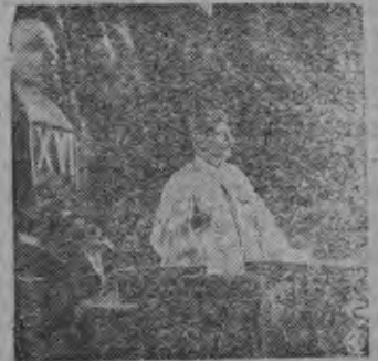
Художник Герасимовонь картиназо пельксээ „Сталин ялганть 16 партсездэ дон ладозо“.