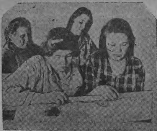
„Од Ки“ колхозонь молхозницатне викшнить экспортной вешат

Пазонть коренга Седстан лутыя, Тона чинть марто Врагоать стувтыя.