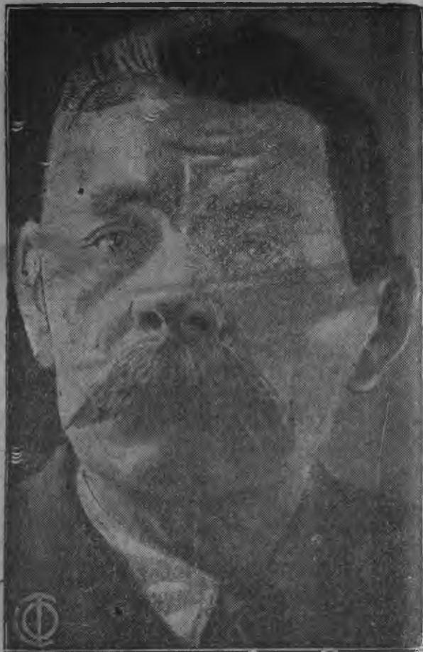
М. Горький СССР нь советской писателень союзонь оргкомитетэнь председателъ