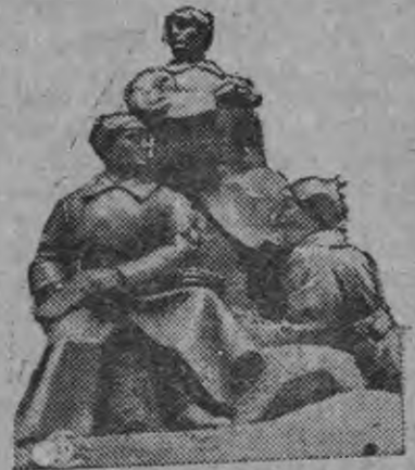
Пилъ ииковонь. скульптуразо вьистаекан совамсто