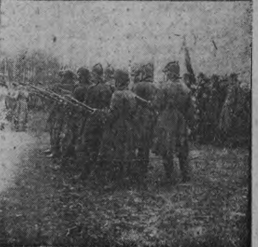
Маень 1-це чись Саран ошсо