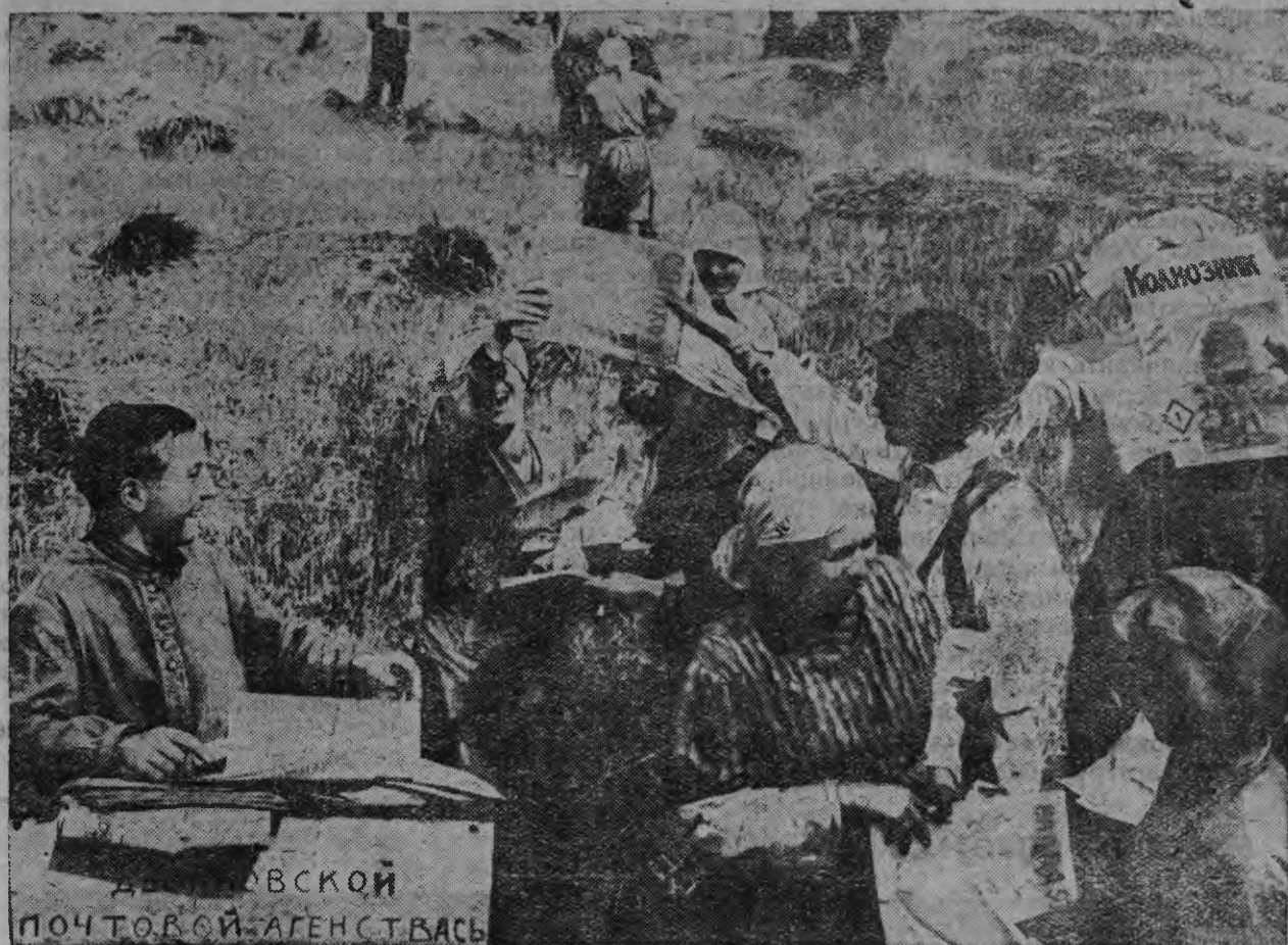
Двойневской почтовой агентствась колхозонь пакясо