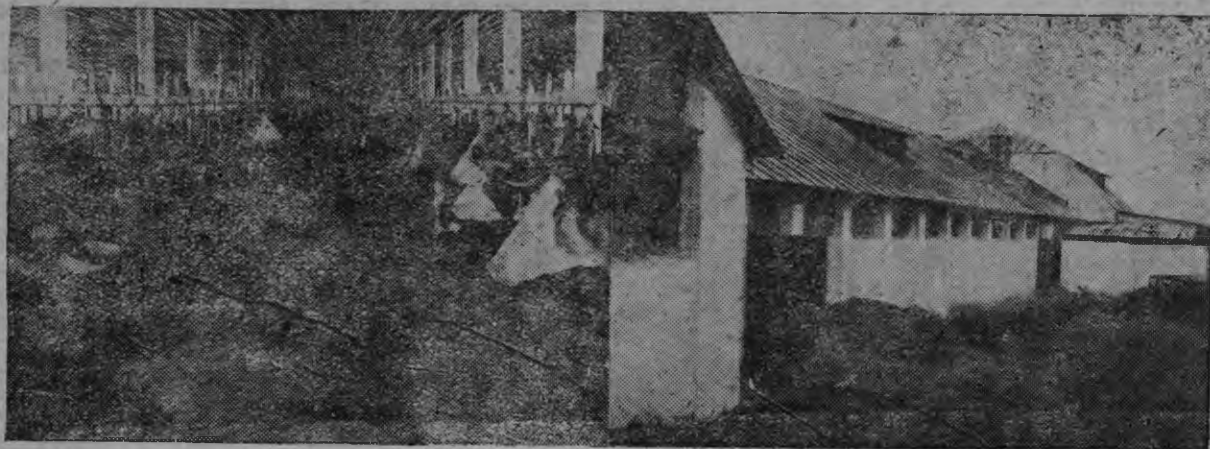
Скотинань трамо-раштамо совхозонь сналонь нардо—нерш ено потмозо, вить ено—ушоенкосо