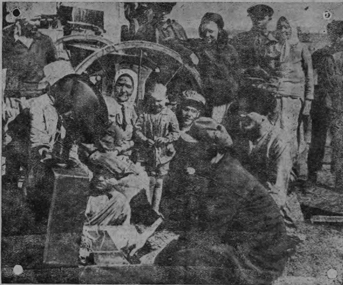
Колхозонь панксясо радиоустановка