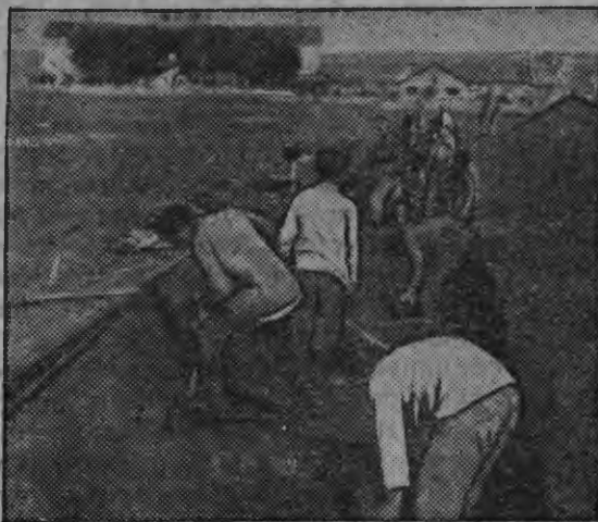
Чувить тарка консервстроень фундаментэнтэ туртов (Саран ош)

Эряви кеместэ туремс весе орматнень каршо, виевгавтомс здравпунктнень строительствань тевенть ды санитарно-профилактической робутанть. Народной образованиянь тевсэнтэ кеместэ туремс коммунистической воспитаниянь вадря качествантэ кисэ, школатнень политехнизациянтэ ды школань производственной задачатнень кисэ. Тень кувалт икелейгак эряви анокстамс вадря педагогической кадрат ды теемс учительтнецень вадря условият. Партиянь програмастонь эривисодамс пунктонть, "кона корты:„ Пролетариатонь диктатурань шкасто, лиякс меремс сеть условиянь анокстама шкасто, конань видесэ тееви комунизмась, школась улезэ аволь ансяк комунизмань принципень ютавтыцьякс, сон должен улемс пролетариатонтень лиянияно