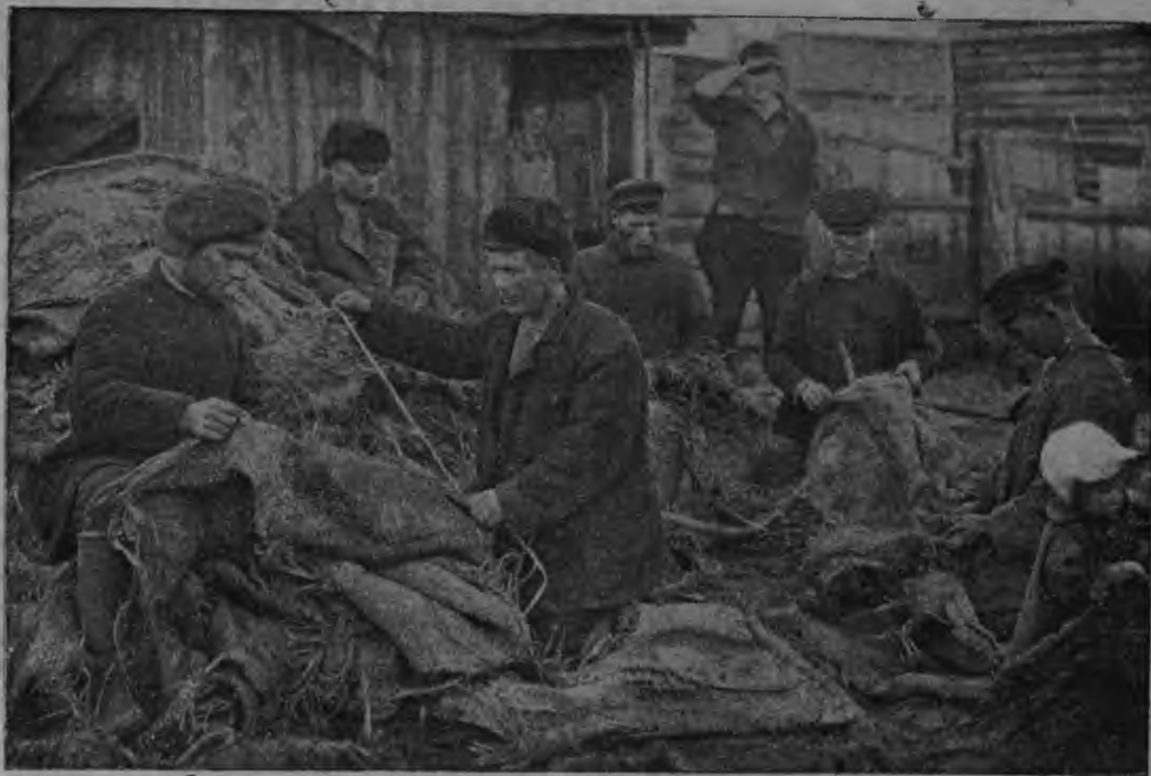
Московсо эриця эрзя-мокшотне рогожат стыть.