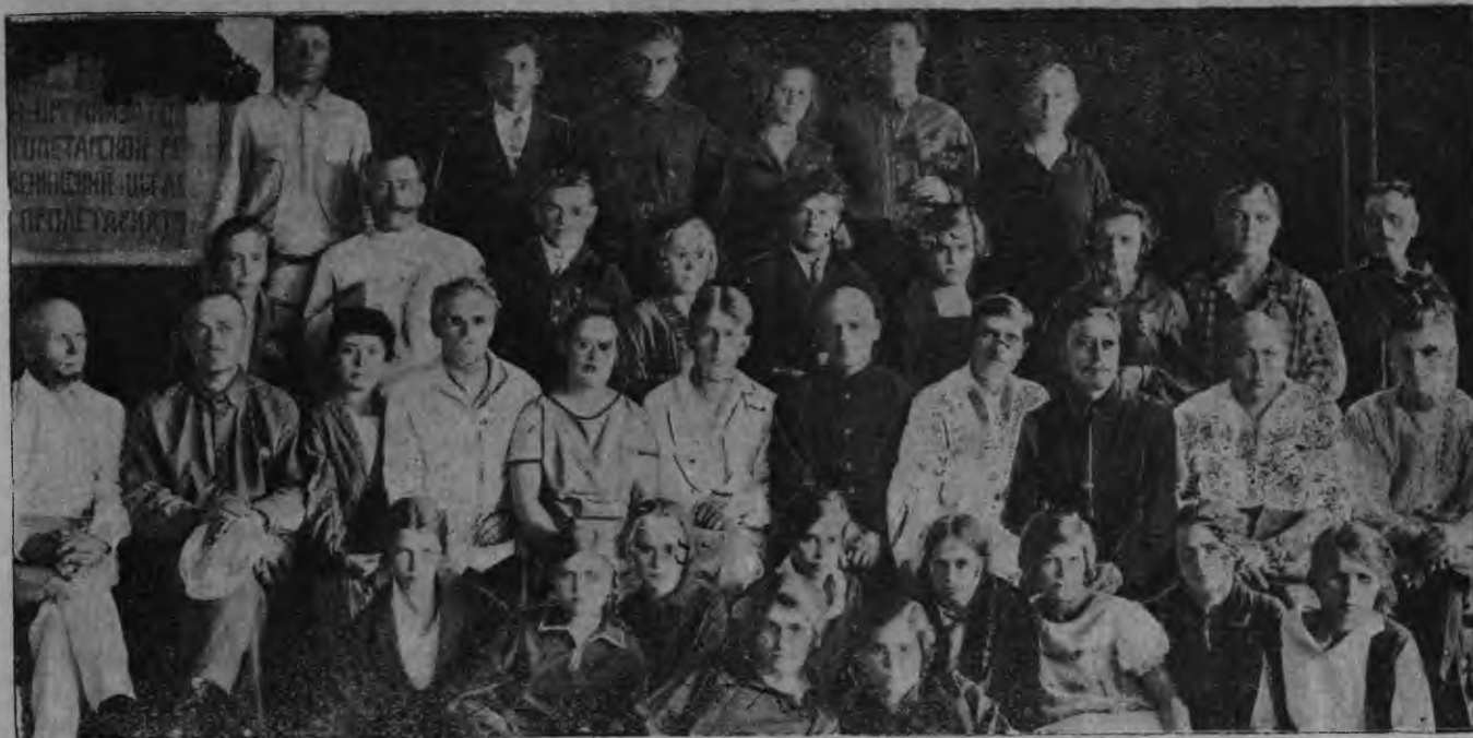
Алатырень эрзя-мокшонь педтехникумсить тедидень выпускозо.