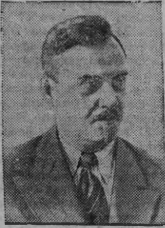
Суред выльи: РСФСР-лэн Народной Комиссар'эсылэн Советэзлэн председателез Николай Александрович Булганин.