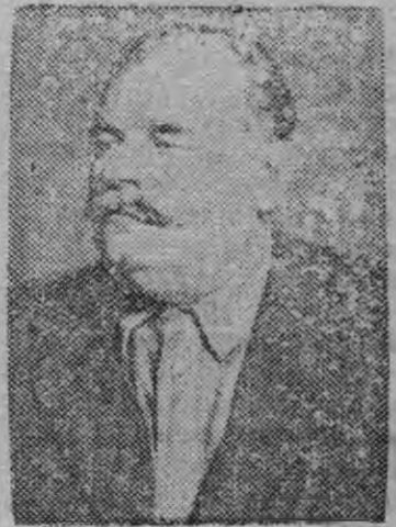
РСФСР-лэн Верховной Советэзлэн Президиумезлэн председателез А. Е. Бадаев эш.