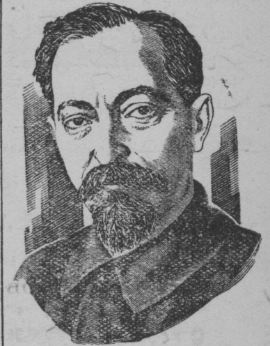
Феликс Эдмундович Дзержинский.

20 июля исполнилось пятнадцать лет со дня смерти Ф. Э. Дзержинского