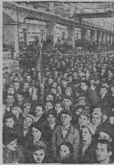
Митинг на Московском заводе „Динамо“ имени Кирова в связи с заявлением Заместителя Председателя Совнаркома СССР и Народного Комиссара иностранных дел тов. В. М. МОЛОТОВА (22 июня 1941 г.).