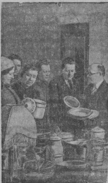
Выставкалөн посетительяс видзёдённы посудно-хозяйственнóй отделёсь экспонатьясь.

Москваын Май 1 лунё Краснóй площадь вылын артиллериялён парад.