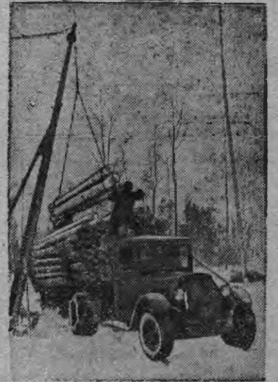
Дерри-кранэн дресинаез автомашинае тырон. (Карельской АССР)