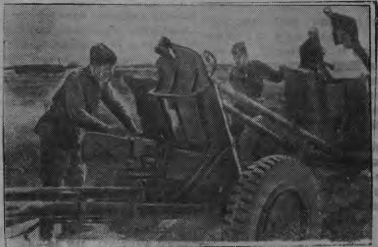
Красноармеецъёс эскеро бой дыръя фашистъёслэсь отбить карем орудысты.