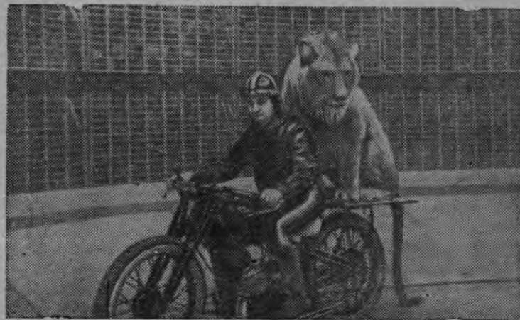
Цирковой номер „Круг смелости“. Мотоциклэтен лев. Дрессировщик — артист орденоносец Александр Буслаев.

Московской Ленин ордене Государственной циркыи