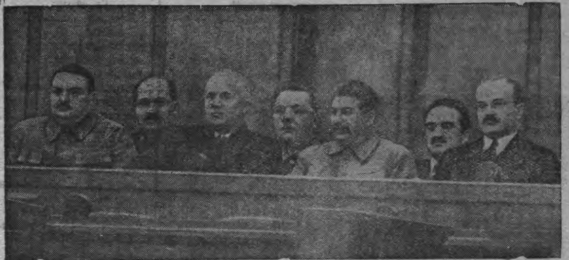
Партиелэн но правительстволэн кивалтисёсы Союзлэн Советэзлэн но Национальностёслэн Советсылэн огазын заседаниязы. Бурьсеп паллан пала: В. М. Молотов, А. И. Микоян, И. В. Сталин, К. Е. Ворошилов, Н. С. Хрущев, Л. М. Каганович, А. А. Жданов эшгёс.