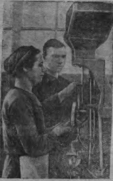
Москвысь Л. М. Каганович нимо 1-тй Государственнй пдшипниково заводлэн стахановецёсыз многостаночникёсыз сортировщица Е. К. Стольниково но наладчик П. Я. Чиликин.

сырьсь вераськон мына, со тодро луо. Отын, кызы тй тодыськоды, та уж борды кбня ке но кутске склэм, и уж валамон луэ. Нош тани болтунтёс сырьсь уж озы ик тодымтэен кылэ. Отын склэм гинэ уг тырмы, лэся. Кулэ йырын ужаны но болтунтэз дыраз тодоно.