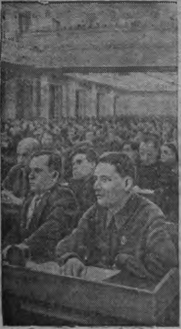
ВКП(б)-лэн XVIII Всесоюзной конференциелэн заседать карон залаз.