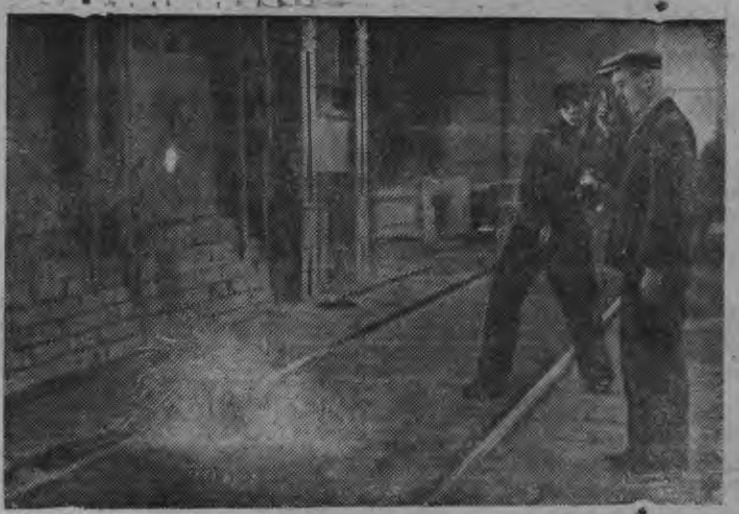
Ново Тагильской металлургической заводлэн мартиновской гурез „НТМЗ“ маркае нырысетйи сталь сётны. СНИМОКЫН: Металлэс проба басьтом.

Сычесь луэ, эшлэс, промышленностьлэн данак удысьскыи лэн лэб ужалзылэн мугтэсьскыи, сычесь луэ промышленностьлэн но транспортлэн ужазы тырмытэослэн мугтэсьскыи.