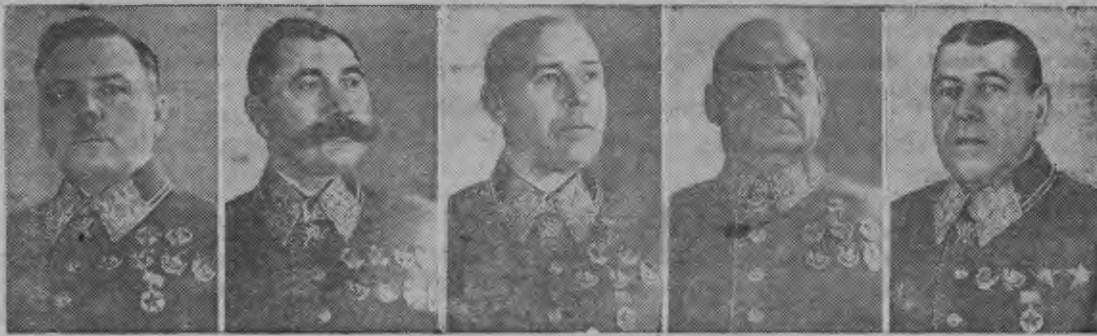
Советской Союзлэн Маршалэз К. Е. Ворошилов.