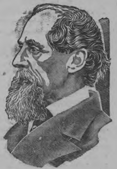
Знаменитой английской писательлэн Чарльз Диккенслэн кулэмез дырысен 9 июне 1940 арын 70 ар тырмиэ. Суредын: Чарльз Диккенс