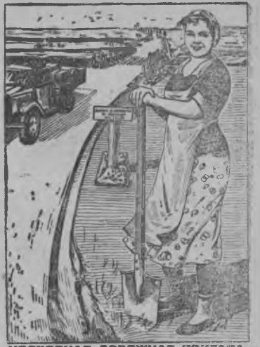
КОЛХОЗНАЯ ДОРОЖНАЯ БРИГАДА—ЛУЧШАЯ ФОРМА УЧАСТИЯ СЕЛЬСКОГО НАСЕЛЕНИЯ В СТРОИТЕЛЬСТВЕ И РЕМОНТЕ ДОРОГ

приемной испытаниосты Глазов городын 23 сентябрь (включительно) орччтэ Сибирской ульчаысь 10 номеро коркан. Школаез кутысько 7 классэз быдэстэм'ёс 1921—22—23—24 ар'ёсы вордскем мурт'ёс.