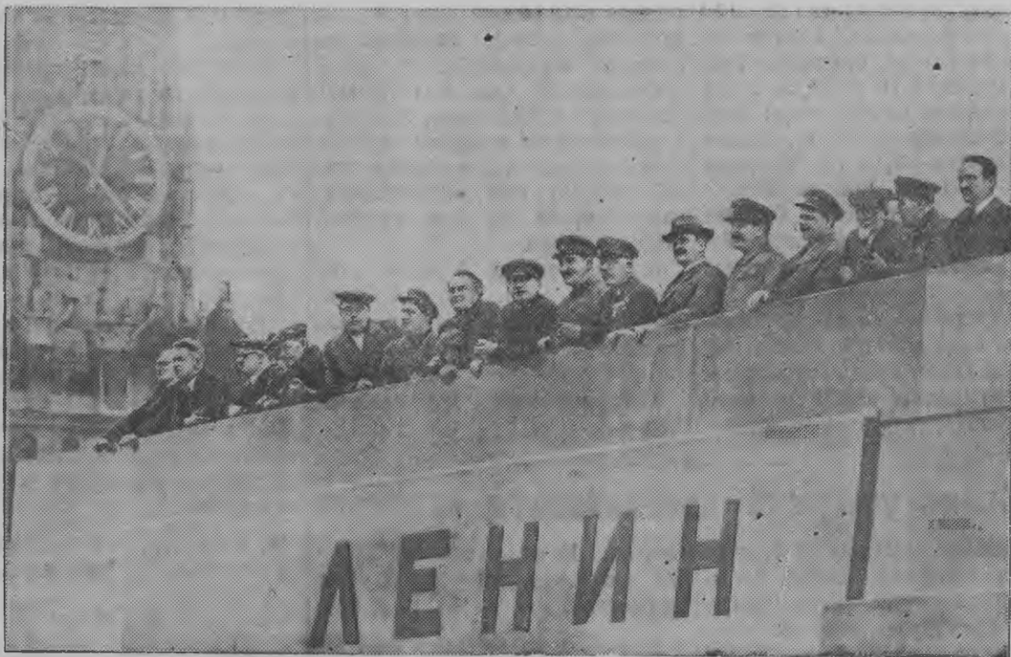
Мавзолейлэн трибуна вылаз 1939 арын 1 мае.

Ужано еще но умой но юрттоно бере кыдысьёсызлы — азымынйёс дышетисьёслэн долгзы. Чошатсконо азымынйёссыя, соослэн мастерствоенызы овладевать кароно—советской дышетисьёслэн быдэс армизылэн обязанностез.