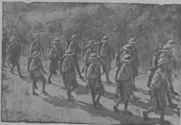
Снимокын: Китайской Армилен пехотаезлен отрядэз фронтэ мына.