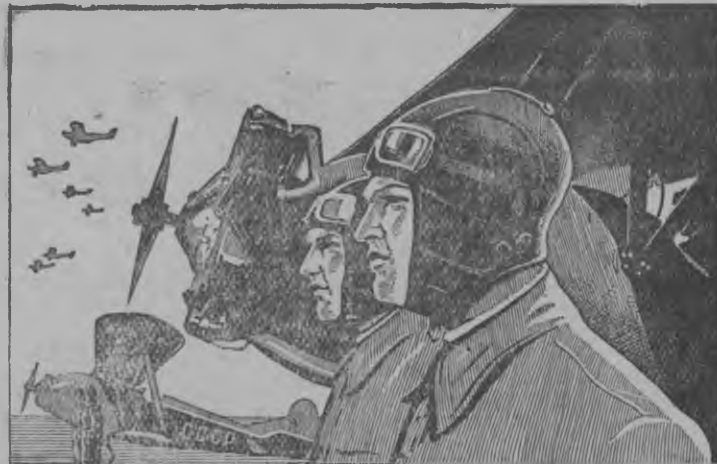
ДА ЗДРАВСТВУЮТ СОВЕТСКИЕ ЛЕТАЧИКИ, ГОРДЫЕ СОКОЛЫ НАШЕЙ РОДИНЫ! УЧДСТИЕМ В 13-й ЛОТЕРЕЕ КРЕПИТЕ ОСОАВИАХИМОВСКОМУ АВИАЦИО!

Правительство удовлетворить кариз Харьковской завод'эсысь рабочий'эслэсь куремэс но разрешить кариз 1 майысен 15 июлэз орчтытыны Осоавиахимлэсь 13-тй Всесоюзной лотереязэ. Та лотерея потт'ыське 135 миллион манет тыр.