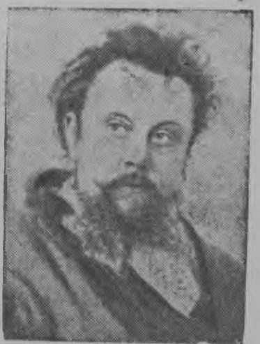
Снимокыны: М. П. Мусоргский.

Великой русской композиторлэн М. П. Мусоргскийлэн вордскем нуналъёсыныз 28 мартэ туэ 100 ар тырме.