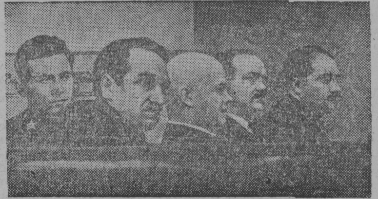
ЖЕЖОВ, МИКОЈАН, КОГИОР, МОЛОТОВ да КАГА-НОВИЧ јортјас Национальноетјас Сӱветлӱн первой Герсӱја вылын.