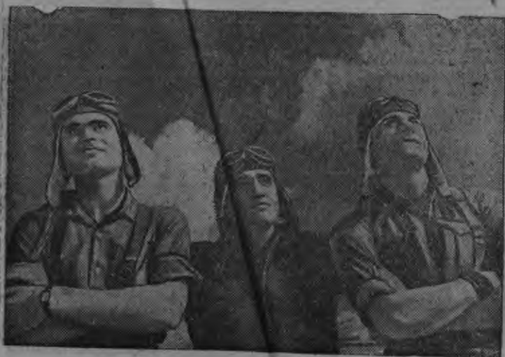
Снимок: Республиканской Испаниян егит лётчикёсыз республиканской самолётёслэс аскадрильязылэс лобэмэс следит каро. ТАСС-лэн Бюро-клишеез.