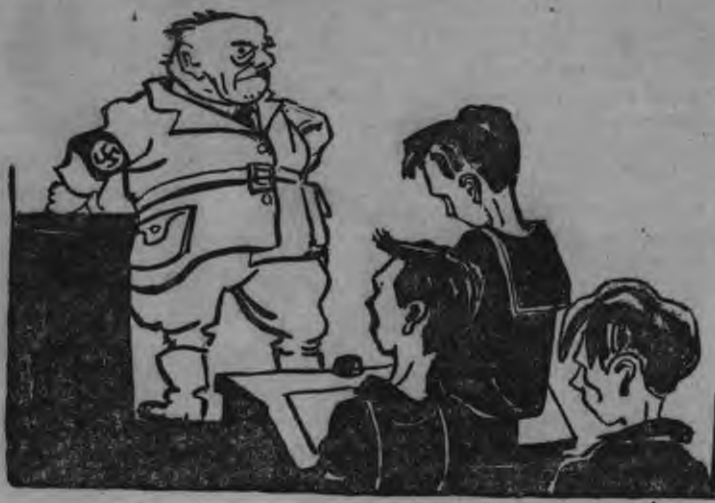
— Пиналэсь, тилдэ мар каремды потэ: гождьсьемды-а или лэдэсьемды-а? — Милям сиеммы потэ.